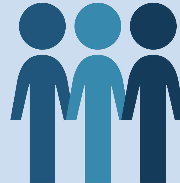
ET STÆRKT FÆLLESSKAB